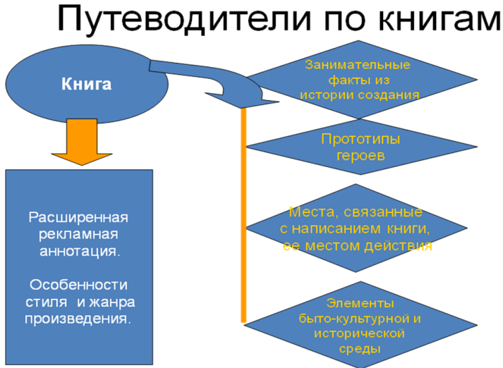
Рис. 2. Схема Путеводителя по книгам

Хочется подробнее остановиться на такой яркой, нестандартной форме как Бенефис литературного героя.