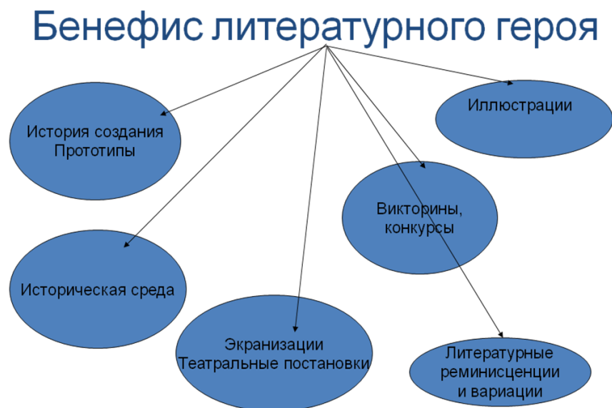
Рис. 3. Схема Бенефиса литературного героя

Таким образом, литературный герой предстает в органическом единстве с исторической и художественной средой, в многообразии культурных воплощений.